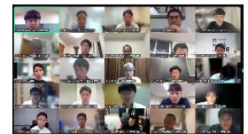
↑ 第5回授業研究会の様子